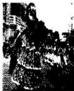
La Chatona y el Caballito Publicada en Nuestro Diario, 2007