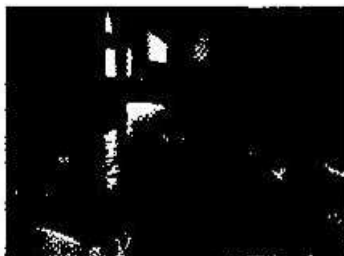
Silvia Chajón, 2013