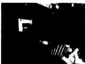
Silvia Chajón, 2013