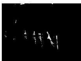
Silvia Chajón, 2012